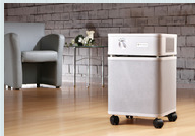
Purificatore ai carboni attivi con filtro HEPA